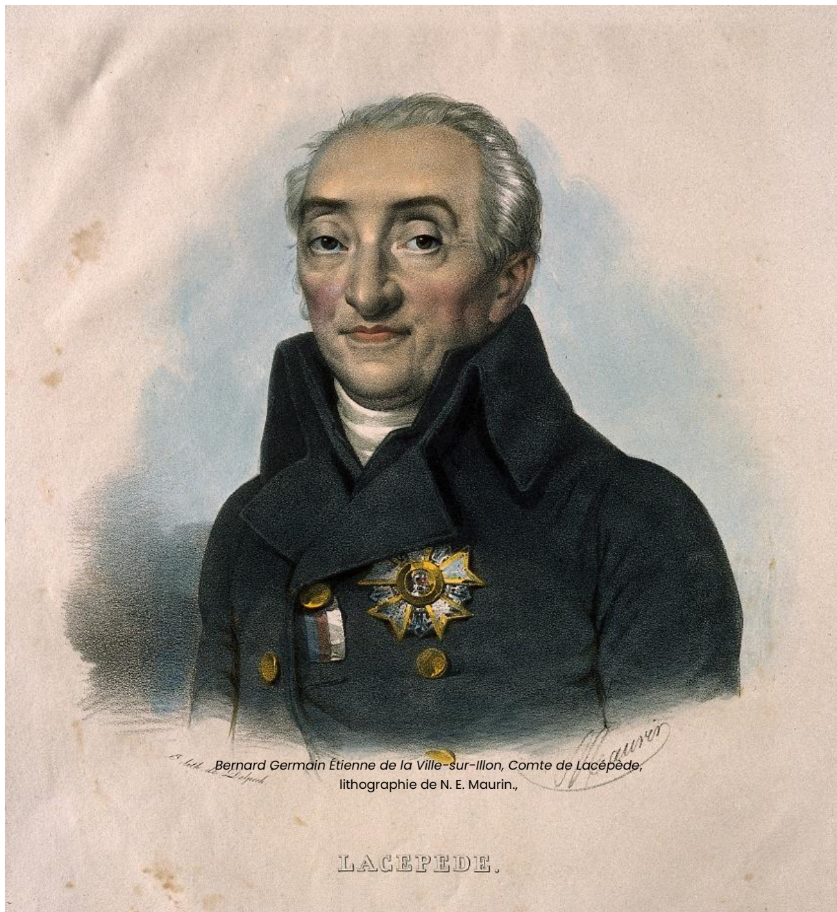
Bernard Germain Étienne de la Ville-sur-Ilлон, Comte de Lacépède